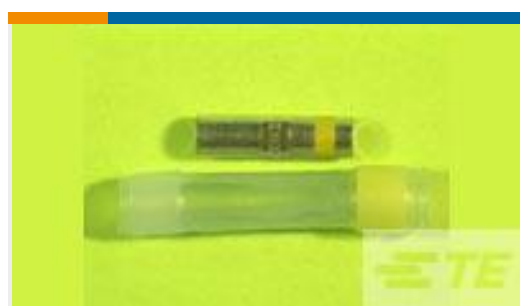
TE 产品编号 650075-000 D-436-37