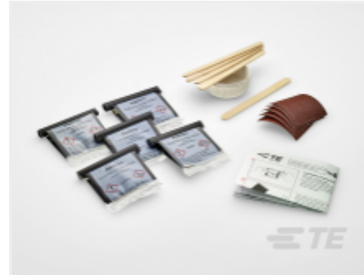
TE 产品编号931156-000 S1125-KIT-4