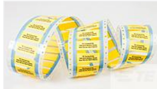
TE 产品编号6641710001 TMS-SCE-1/4-2.0-9