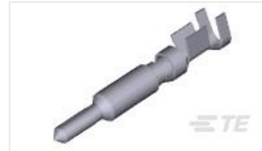
TE 产品编号1-770007-0 UMNL II PIN AUSN/NI/BR