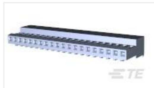
TE 产品编号5-640440-0 20P MTA100 CONN ASSY 22AWG RED