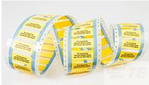
TE 产品编号617917-000 TMS-SCE-2X-1K-1/4-9