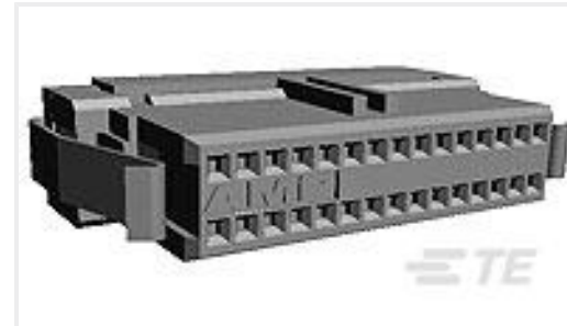
TE 产品编号111196-5 024 RCPT SYSTEM 50 30 DPLX