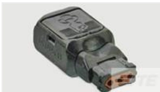
TE 产品编号D369-P33-AP1 369 3 WAY PLUG, CRIMP, PIN