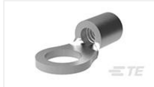
TE 产品编号31172 BODY,RING TONGUE 22-18