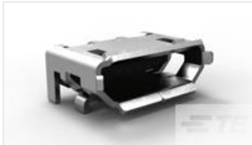
TE 产品编号2040002-1 MICRO USB, TYPE B