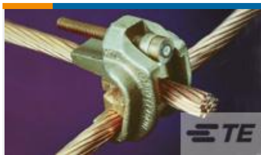
TE 产品编号83749-2 WRENCH-LOK 3/0-3/0, 300-#2