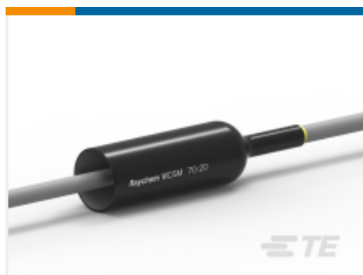
TE 产品编号EE0481-000 WCSM-70/20-600S(B10)