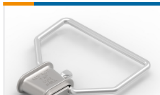
TE 产品编号81667-1 STIRRUP, 1/0, TYPE II AMPACT