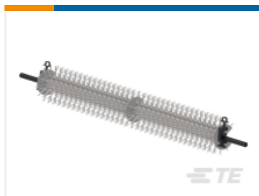
TE 产品编号EN7339-000 WLG-60(B1)