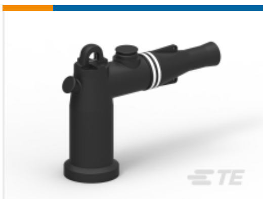
TE 产品编号EE5623-000 Loadbreak Elbow: 200A, 15 and 25 kV