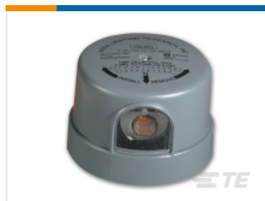
TE 产品编号636452-000 ALR-M-480