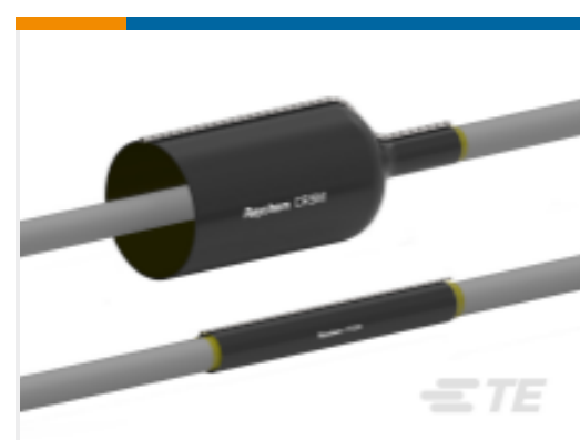
TE 产品编号 CAT-CRSM 用于电缆维修的拉链套管