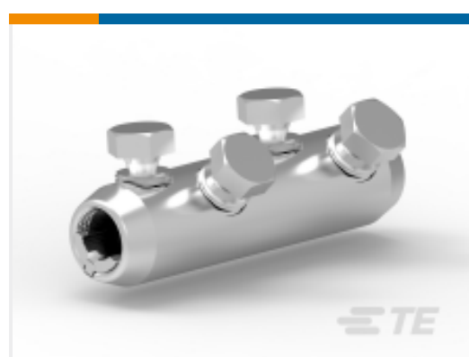
TE 产品编号 CAT-BSM 机械式接管和维修套管