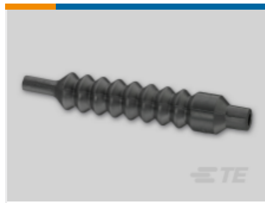
TE 产品编号806251-000 旋绕热缩单管护套：有嘴，直形