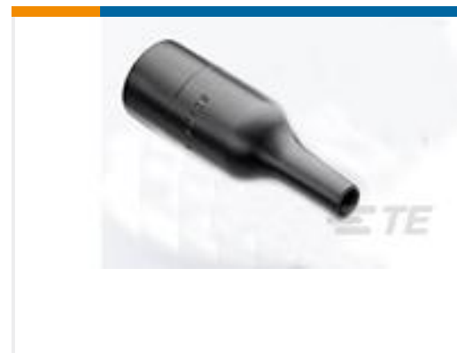
TE 产品编号CV7373-000 202K153-25L-0