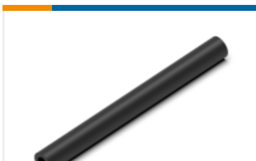
TE 产品编号CN5946-000 EN-CGAT-6/2-0-1200