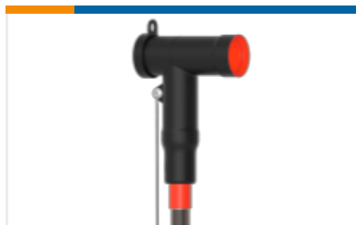
TE 产品编号CM0012-072 屏蔽式可分离连接器 1250 A