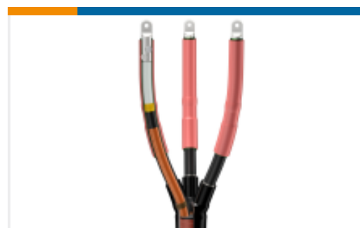
TE 产品编号E92435-063 POLT-12D/3XIH1