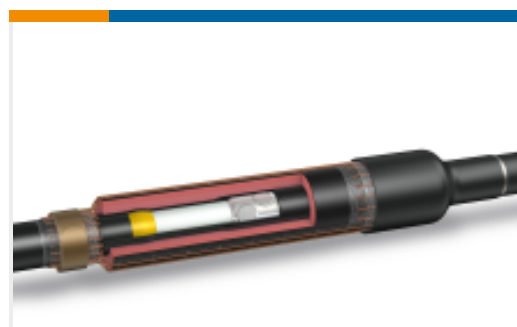
TE 产品编号E67139-069 POLJ-24/1X120-240