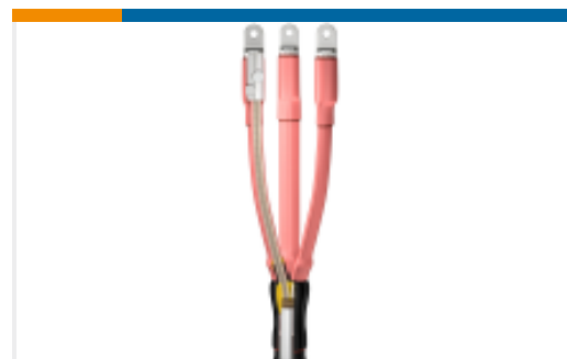
TE 产品编号A31452-070 GUST-12/70-120/800-L12