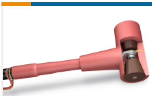
TE 产品编号555340-070 RICS-5123