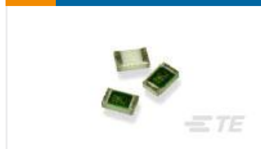
TE 产品编号9-1879221-7 CPF 0603 16R9 0.1% 25PPM 1K RL