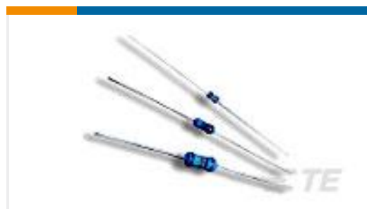
TE 产品编号2-1879026-6 YR1 0.1% 17R8