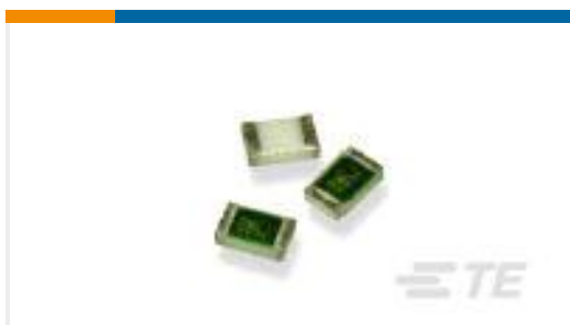
TE 产品编号1-1879222-7 CPF 0603 28R 0.1% 25PPM 1K RL