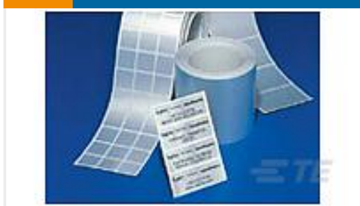
TE 产品编号F07599-000 MP-508254-5-8A