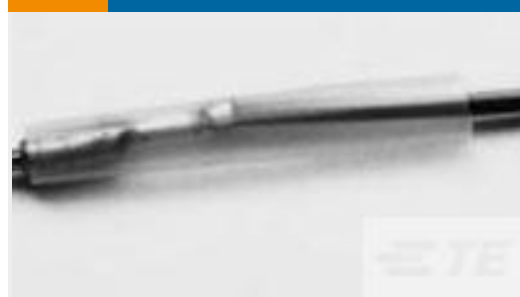
TE 产品编号CV25894001 RW-175-E-1/2-X-SP