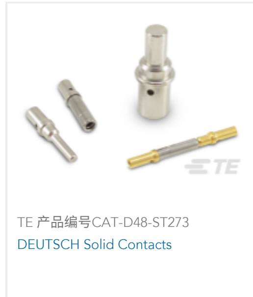
TE 产品编号CAT-D48-ST273 DEUTSCH Solid Contacts