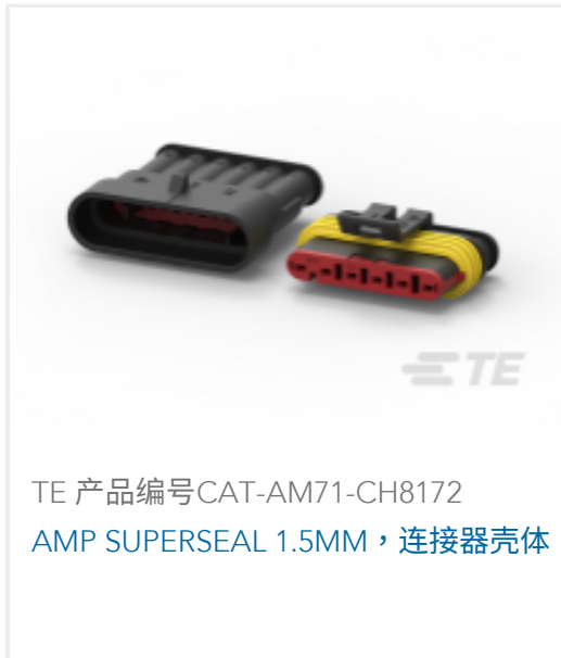
TE 产品编号CAT-AM71-CH8172 AMP SUPERSEAL 1.5MM，连接器壳体