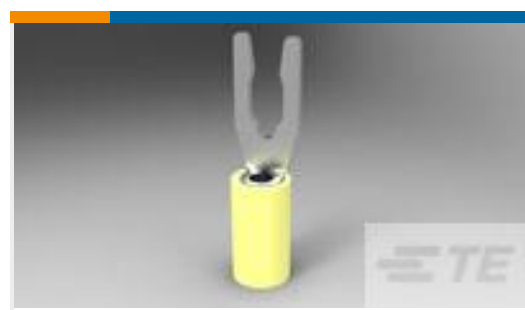
TE 产品编号52430-3 TERMINAL,PIDG SPR SPD 12-10 6