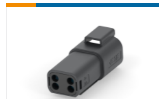
TE 产品编号1-2600030-0 4CCT BLACK RECEPT W/LARGE SEAL