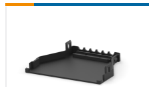
TE 产品编号1776695-1 Strain Relief, D5200, Dynamic