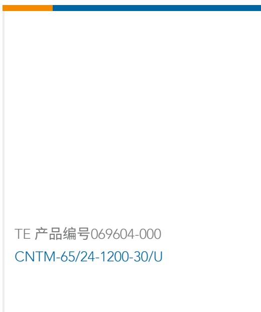
TE 产品编号069604-000 CNTM-65/24-1200-30/U