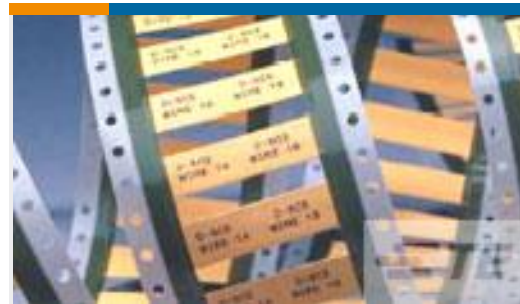
TE 产品编号646331-000 D-SCE-1K-12-50-S1-4