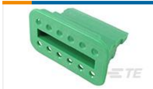
TE 产品编号W12S-P012 WEDGE LOCK, 12P, PLG, GRN, SL RET, DT