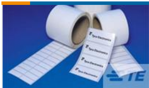
TE 产品编号9-1768018-6 EET-3460P-9