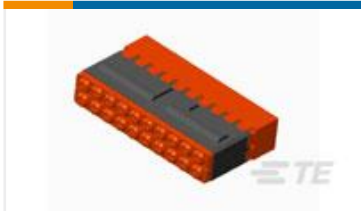
TE 产品编号850957-000 MTCP-122-20PQ