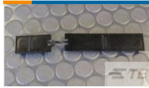
TE 产品编号211600-1 COVER, DUST SIZE 1 NIC600