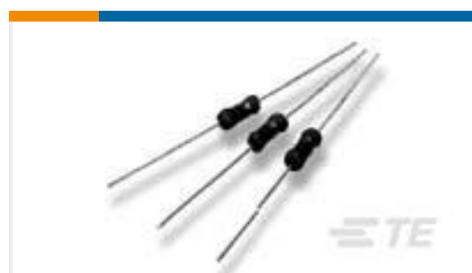
TE 产品编号2-1879354-3 RR03 5% 2R7 AMMO