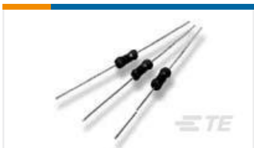
TE 产品编号1-1879354-9 RR03 5% 1R8 AMMO