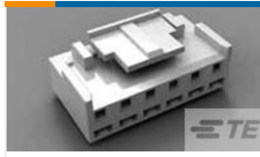
TE 产品编号1-1123722-3 3.96 EP PLUG HSG 3P(NATURAL)