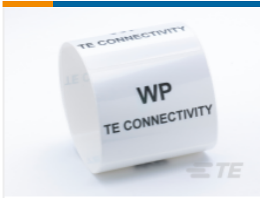
TE 产品编号F01667-000 WP White Polyester Labels