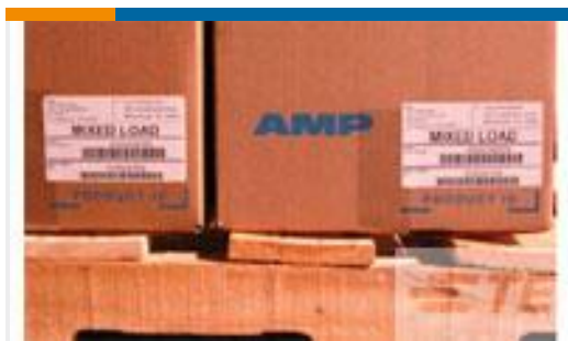
TE 产品编号C33770-000 EP-610419-2.5-9