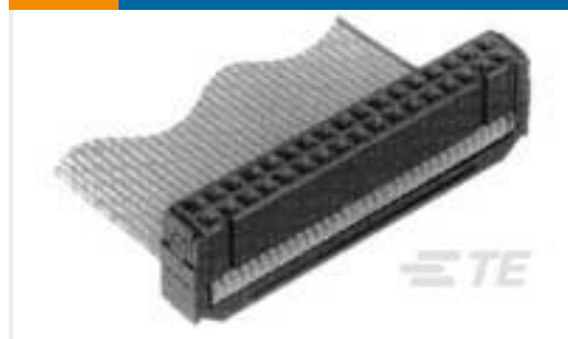
TE 产品编号1658623-4 20 NOVO MIL 30DP, LEAD FREE