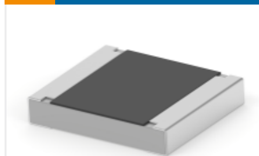
TE 产品编号3-2176346-1 CRGCQ 1210 100K 5%