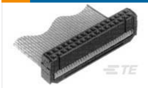
TE 产品编号1658623-3 16 NOVO MIL 30DP, LEAD FREE