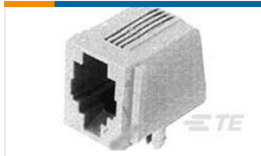
TE 产品编号5520251-4 MJ,R/A,8P,PNL STOPS