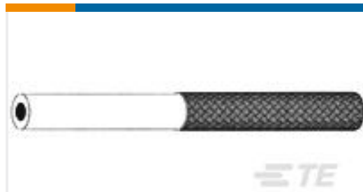
TE 产品编号F866633001 RAY-103-6.0(100)