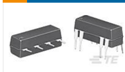
TE 产品编号3-1393771-2 JWS-117-1=REED RELAYS