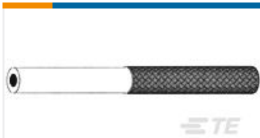
TE 产品编号C750743001 RAY-103-3.0(100)