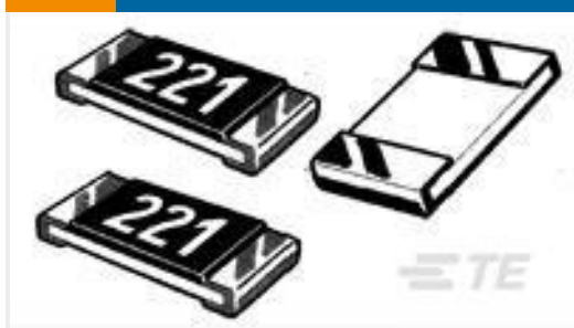
TE 产品编号4-2176070-8 3521 910R 1% 2W