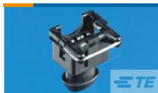
TE 产品编号282762-1 JPT SPLASH-PROOF FEM.CONN2 POS