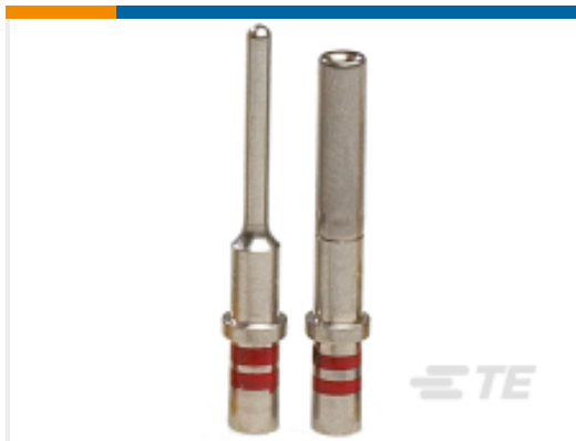
TE 产品编号ZPF00000000001224 097-0104-16