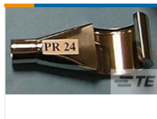
TE 产品编号 991964-000 PR-24-REFLECTOR