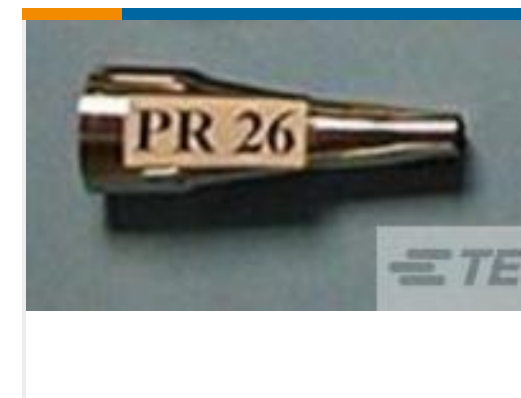
TE 产品编号 991967-000 PR-26-REFLECTOR