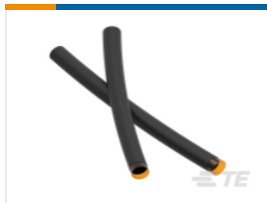
TE 产品编号 NB13892001 TAT-125-1/2-0-STK