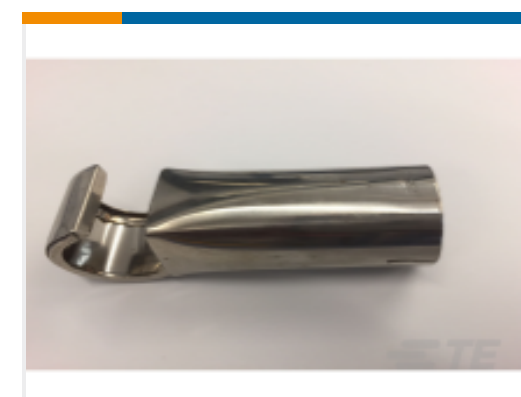
TE 产品编号 991974-000 PR-13C-REFLECTOR