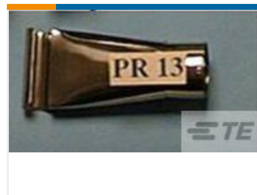
TE 产品编号 991963-000 PR-13-REFLECTOR