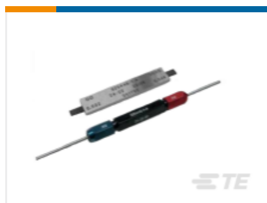
TE 产品编号 523763-2 PLUG GAUGE, HANDTOOL