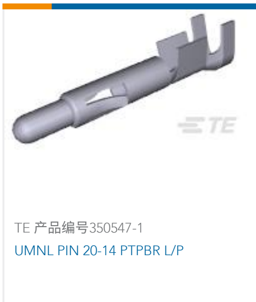
TE 产品编号350547-1 UMNL PIN 20-14 PTPBR L/P