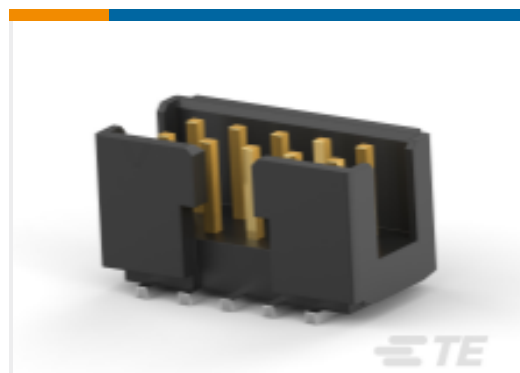
TE 产品编号1-2373376-0 10P,2MM,SHRD HDR,DRVVT,SMD,0.1 AU,TB