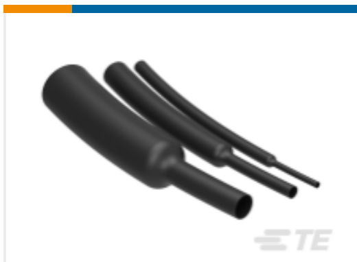
TE 产品编号5069794007 CGPT 2:1 热缩管