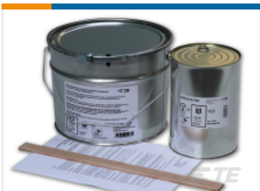
TE 产品编号E57640-000 GUROFLEX-MV-C1000