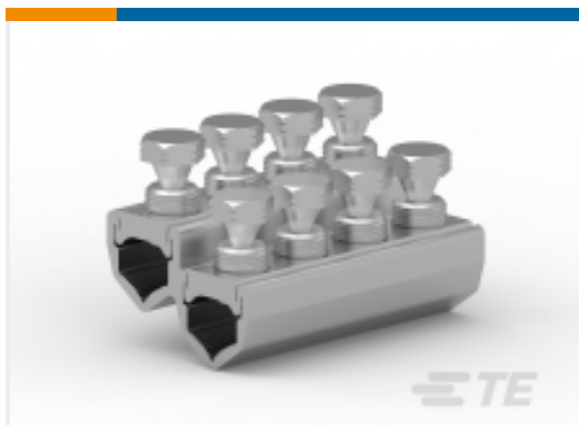
TE 产品编号 185992-000 BAH-023000043