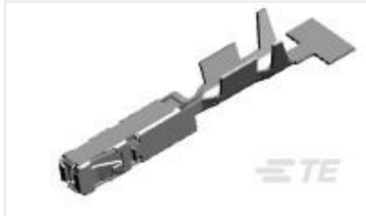
TE 产品编号1418410-1 AMP MCP 1.5K, CONTACT