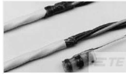
TE 产品编号625250-000 D-128-0008