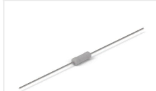
TE 产品编号6-1676123-0 1/2W SM M/OX 5% 240R