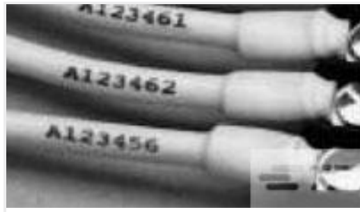
TE 产品编号5054324002 RNF-100-1-1/2-3-SP