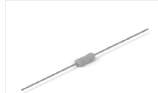
TE 产品编号7-1676123-9 1/2W SM M/OX 5% 1K5