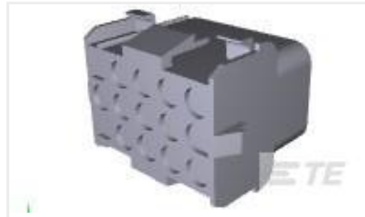
TE 产品编号926647-2 15P UN-MNL AUFN-GEH