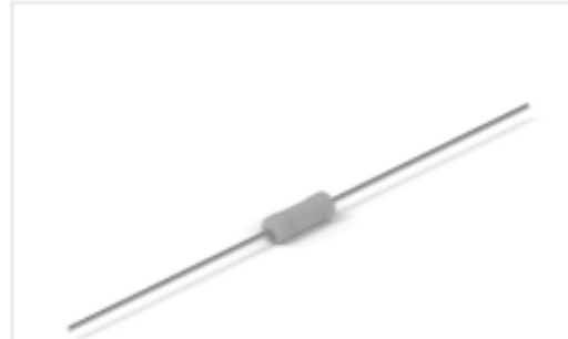
TE 产品编号7-1676123-7 1/2W SM M/OX 5% 1K2