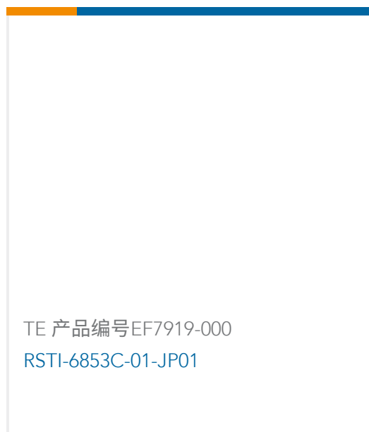
TE 产品编号EF7919-000 RSTI-6853C-01-JP01