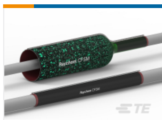
TE 产品编号614982-000 CFSM-100/25-1500/239