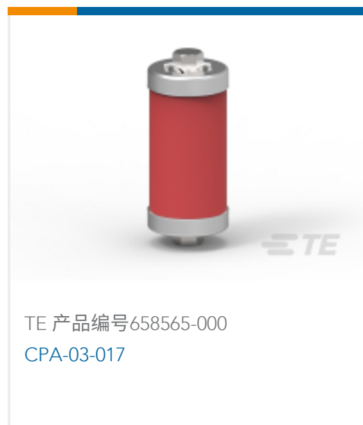
TE 产品编号658565-000 CPA-03-017