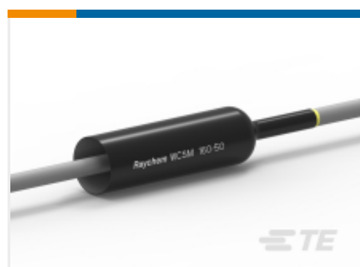
TE 产品编号702924-000 厚壁热缩管