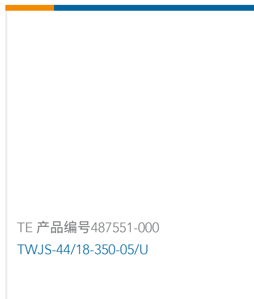
TE 产品编号487551-000 TWJS-44/18-350-05/U