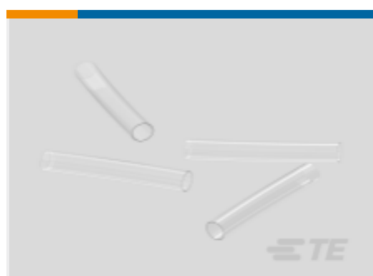
TE 产品编号NB16092001 RT-375-3/64-X-STK