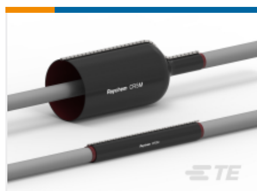
TE 产品编号247537-000 CRSM-198/55-1500/239(S1)