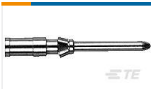
TE 产品编号3-1105050-8 HN.D-C-STI.AG.0,75