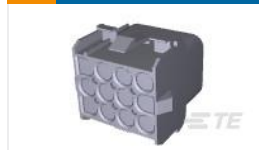
TE 产品编号350783-1 12P UMNL CAP HSG