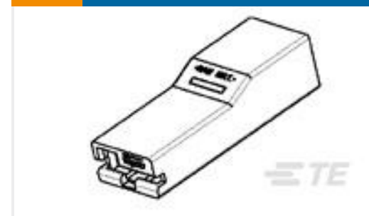
TE 产品编号280232 250 FASTON POST INS.,REC.,1 POS, NATRUAL