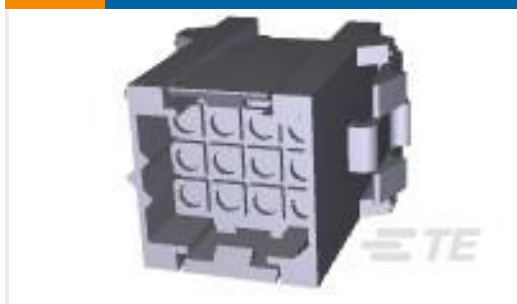
TE 产品编号207018-1 METRIMATE RCPT 12 POS