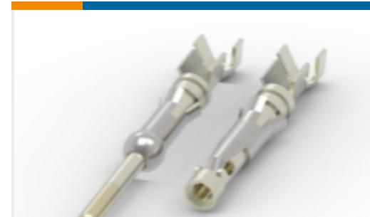
TE 产品编号2-66102-5 Strip Pin and Socket Contacts, Type III