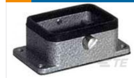
TE 产品编号1-1102291-8 HB-Z.24.AG-ZVGR