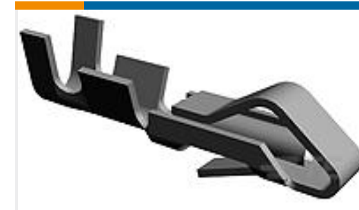
TE 产品编号3-640252-1 045 POST CONT 0126PTPBR