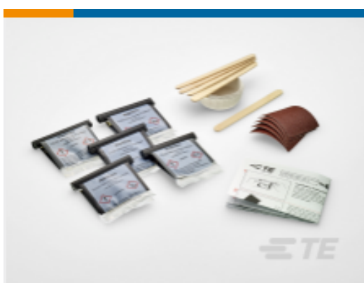
TE 产品编号 931156-000 S1125-KIT-4