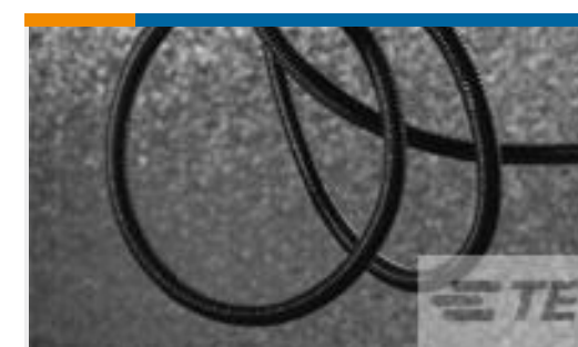
TE 产品编号0378234004 HCTE-0875-0-SP