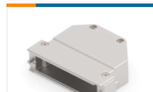
TE 产品编号1-2308345-1 FULL METAL HOODS SIZE 4