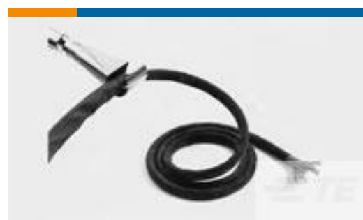
TE 产品编号CB7839-000 RW-200-1/2-0-SP