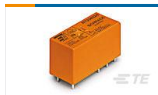
TE 产品编号7-1393243-6 RT424524