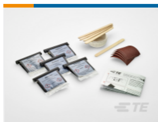
TE 产品编号 878462-000 S1125-KIT-1