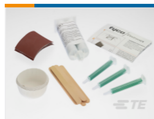
TE 产品编号 657863-000 S1125-KIT-8