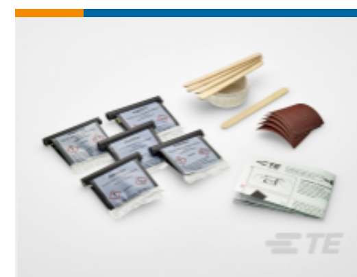
TE 产品编号 583393-000 S1125-KIT-5