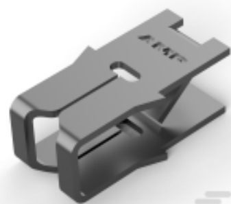
TE 产品编号 1217234-1 MAG-MATE TERM 28-31 013TPBR