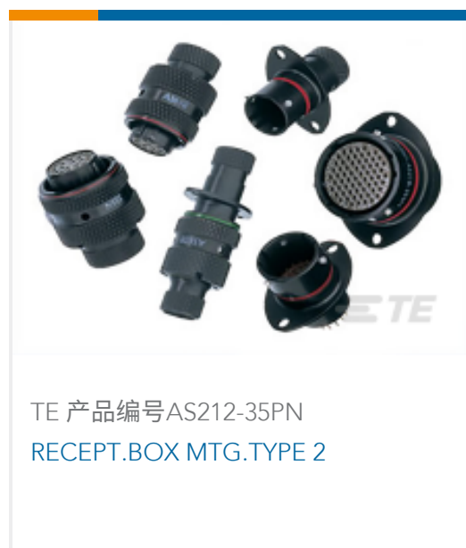
TE 产品编号AS212-35PN RECEPT.BOX MTG.TYPE 2