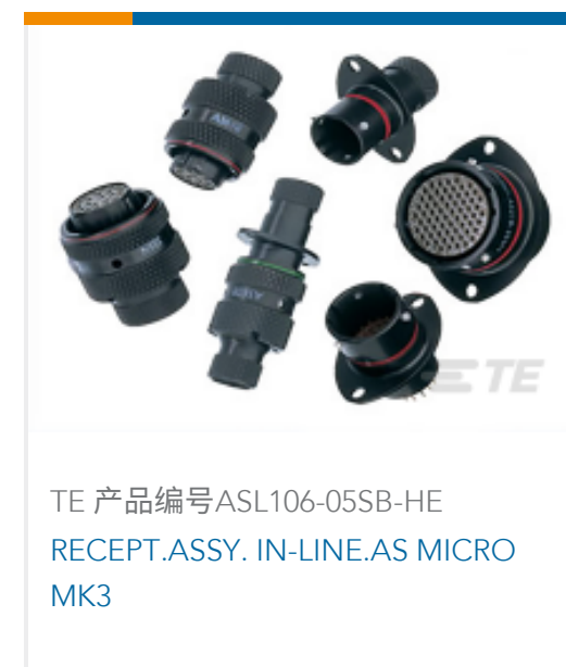
TE 产品编号ASL106-05SB-HE RECEPT.ASSY. IN-LINE.AS MICRO MK3