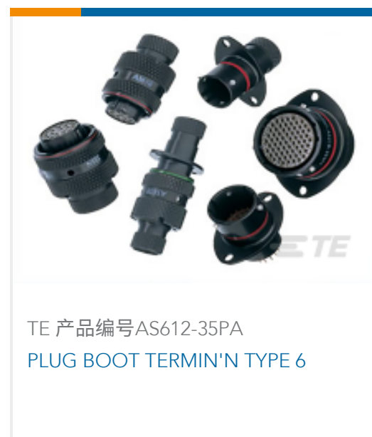
TE 产品编号AS612-35PA PLUG BOOT TERMIN'N TYPE 6