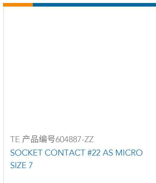
TE 产品编号604887-ZZ SOCKET CONTACT #22 AS MICRO SIZE 7