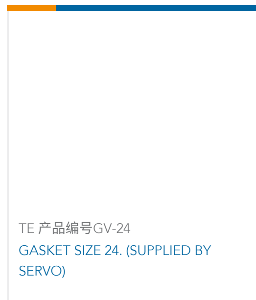
TE 产品编号GV-24 GASKET SIZE 24. (SUPPLIED BY SERVO)