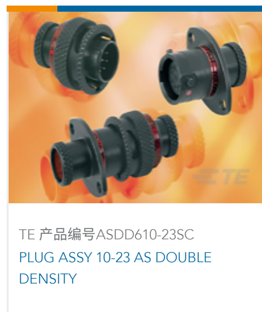
TE 产品编号ASDD610-23SC PLUG ASSY 10-23 AS DOUBLE DENSITY