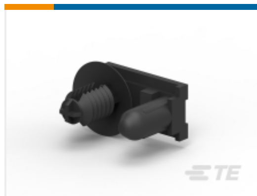
TE 产品编号936784-2 CLIP FOR MT-II/JPT SLD 20P/36P