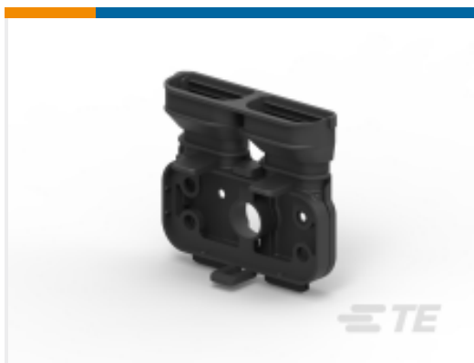
TE 产品编号0528-005-3805 BKSHL, 38P, BLK, PLG, RA, LOW PROFILE