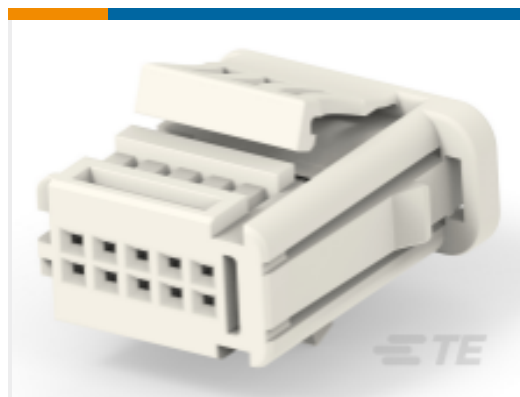
TE 产品编号2208339-2 10POS,NANOMQS,REC HSG,CODB