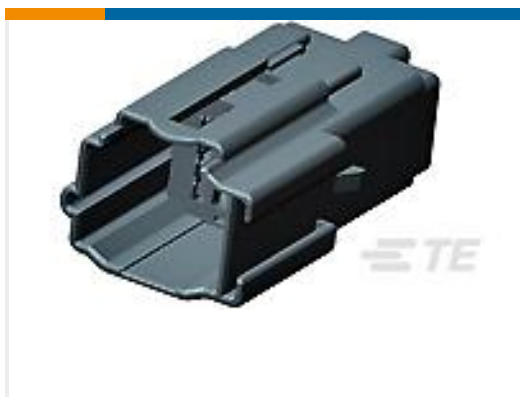
TE 产品编号2141995-1 10POS,TAB 0.63X0.64,PIN HSG,ASSY