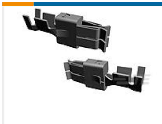
TE 产品编号927824-2 SPT REC 6.3 Contact SRC Sn