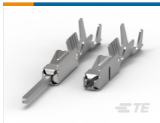
TE 产品编号968072-2 MQS · 母端和公端