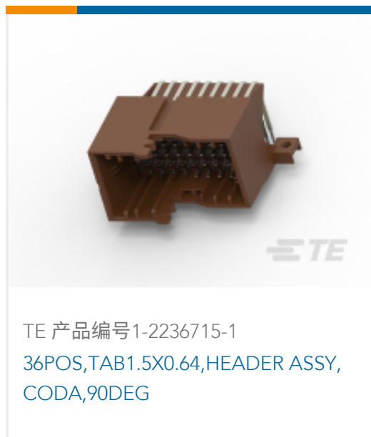
TE 产品编号 1-2236715-1 36POS, TAB1.5X0.64, HEADER ASSY, CODA, 90DEG