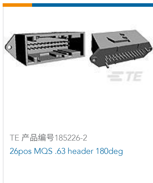
TE 产品编号 185226-2 26pos MQS .63 header 180deg