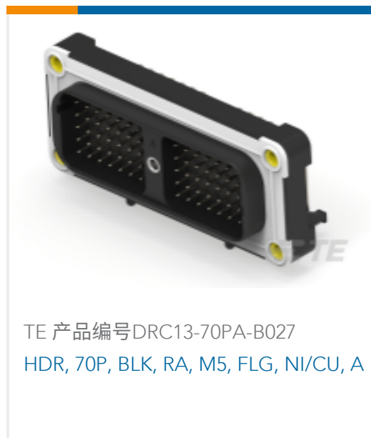
TE 产品编号 DRC13-70PA-B027 HDR, 70P, BLK, RA, M5, FLG, NI/CU, A