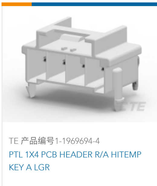
TE 产品编号 1-1969694-4 PTL 1X4 PCB HEADER R/A HITEMP KEY A LGR