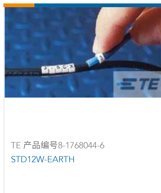
TE 产品编号 8-1768044-6 STD12W-EARTH