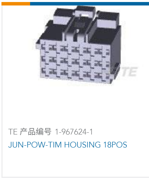
TE 产品编号 1-967624-1 JUN-POW-TIM HOUSING 18POS