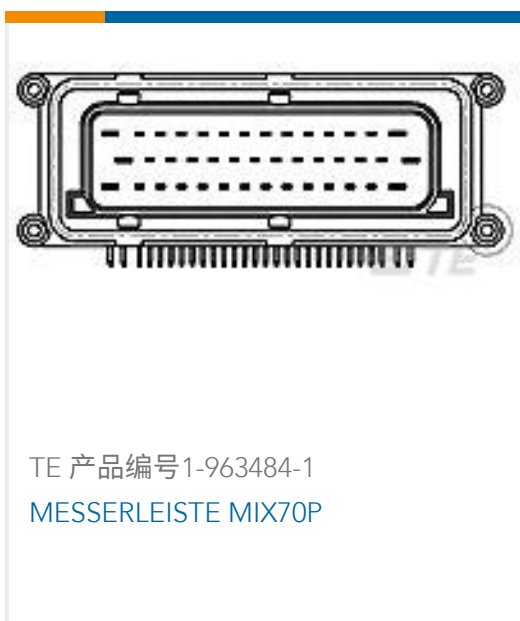
TE 产品编号 1-963484-1 MESSERLEISTE MIX70P