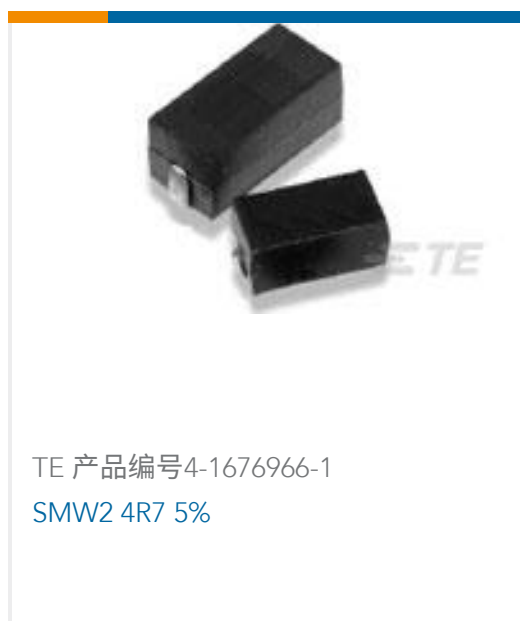
TE 产品编号 4-1676966-1 SMW2 4R7 5%