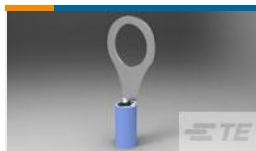
TE 产品编号320564 TERMINAL,PIDG R 16-14 3/8