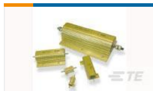
TE 产品编号1630027-5 HSC300 1K0 5%