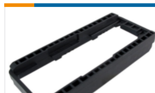
TE 产品编号2138852-3 MOUNTING CLIP, 3MM PANEL, AMPSEAL 16 HL