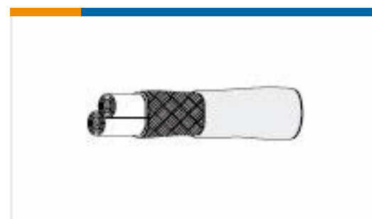
TE 产品编号316079-002 55A1121-26-6/9-9