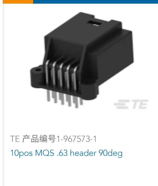
TE 产品编号1-967573-1 10pos MQS .63 header 90deg