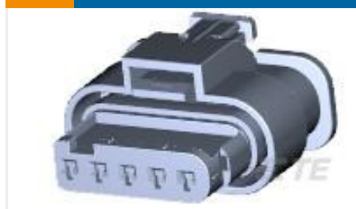
TE 产品编号1-1718806-1 5POS, MCON 1.2 LL REC SEALED