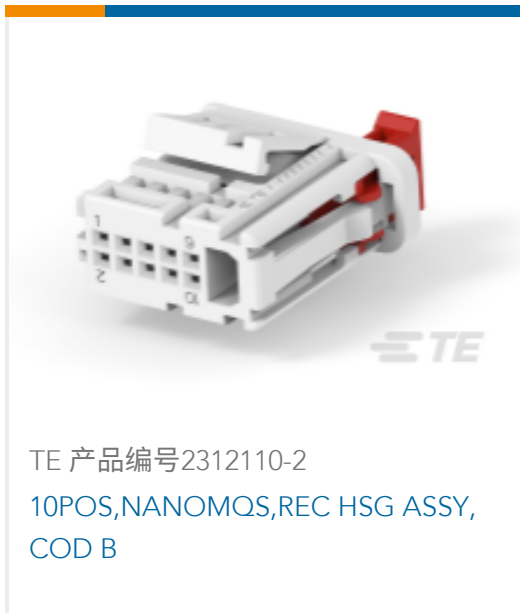
TE 产品编号2312110-2 10POS,NANOMQS,REC HSG ASSY, COD B