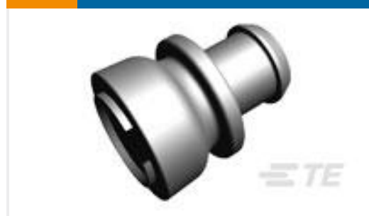
TE 产品编号828922-1 2,5MM CAVITY PLUG FOR 5,4MM DI