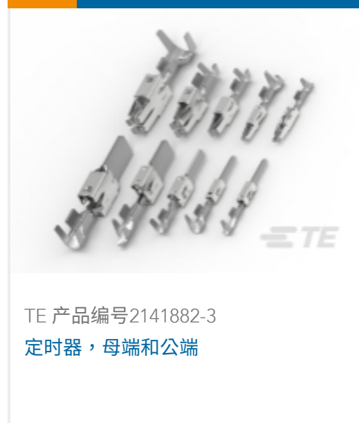
TE 产品编号2141882-3 定时器·母端和公端