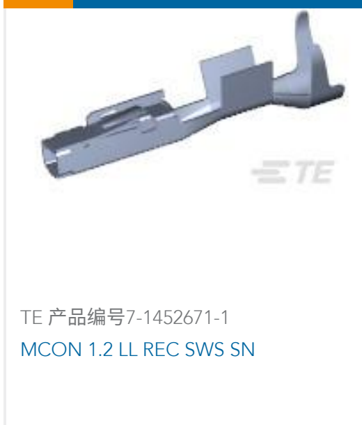
TE 产品编号7-1452671-1 MCON 1.2 LL REC SWS SN