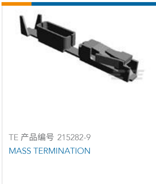
TE 产品编号 215282-9 MASS TERMINATION