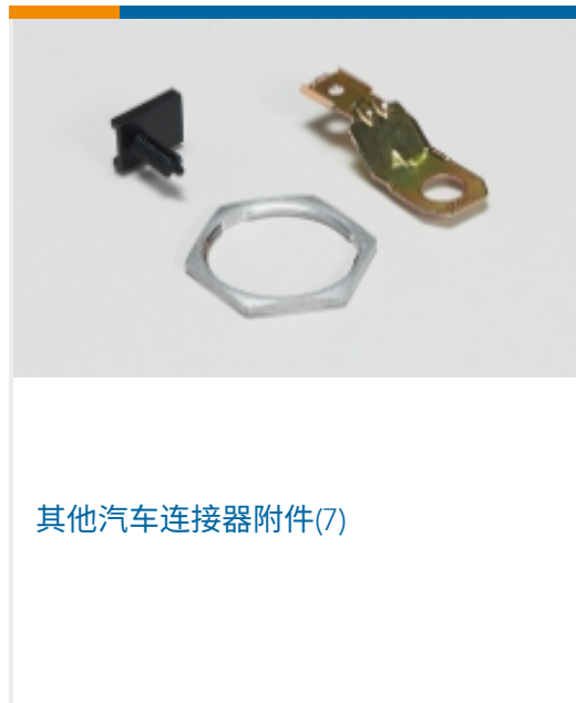
其他汽车连接器附件(7)