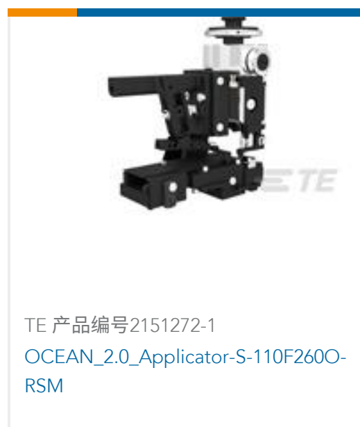
TE 产品编号 2151272-1 OCEAN_2.0_Applicator-S-110F260O-RSM