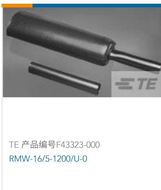
TE 产品编号 F43323-000 RMW-16/5-1200/U-0