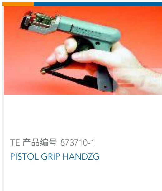
TE 产品编号 873710-1 PISTOL GRIP HANDZG