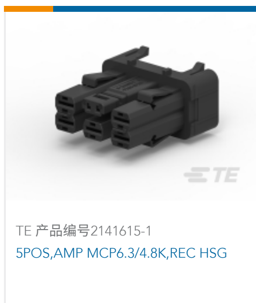
TE 产品编号 2141615-1 5POS,AMP MCP6.3/4.8K,REC HSG