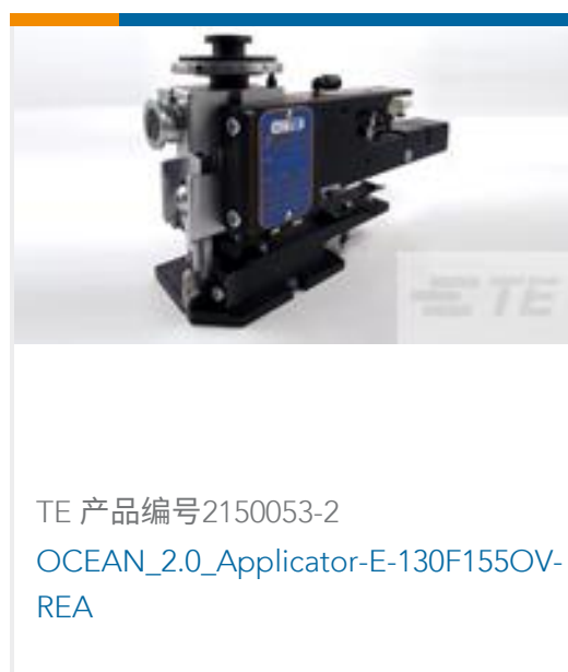
TE 产品编号 2150053-2 OCEAN_2.0_Applicator-E-130F155OV-REA