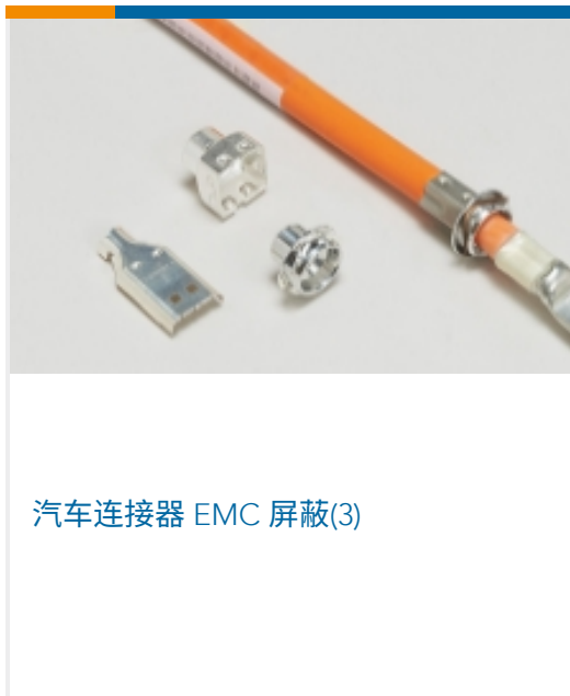
汽车连接器 EMC 屏蔽(3)