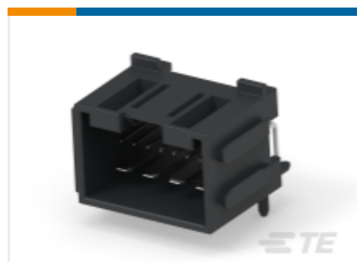
TE 产品编号1-2311788-1 12POS, HYBRID, HDR ASSY, 90DEG, SLDR