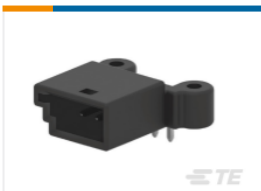
TE 产品编号967598-1 Signal Header