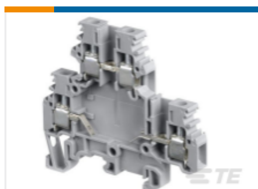
TE 产品编号1SNA115177R1400 M4/6.DE1