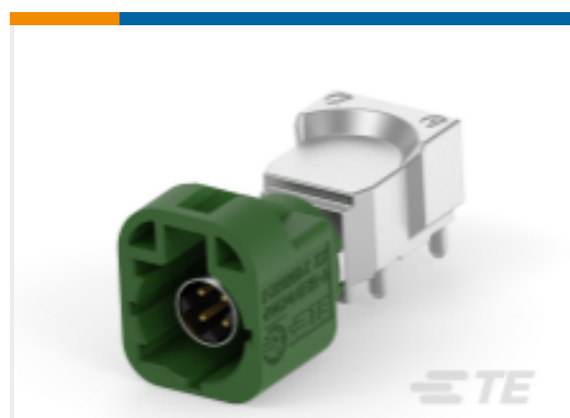
TE 产品编号2291362-5 4POS, PIN DIA 0.6, HEADER ASSY, CODE E