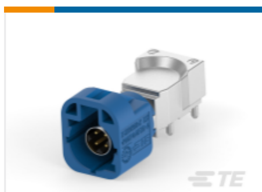
TE 产品编号2291362-3 4POS, PIN DIA 0.6, HEADER ASSY, CODE C