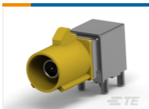
TE 产品编号1-2291392-0 MALE ASM, 1 POS, R/A, PCB, FAKRA