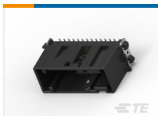
TE 产品编号1-1924678-1 26P SMT LAC HDR ASY, KEY AE, Hand Mate