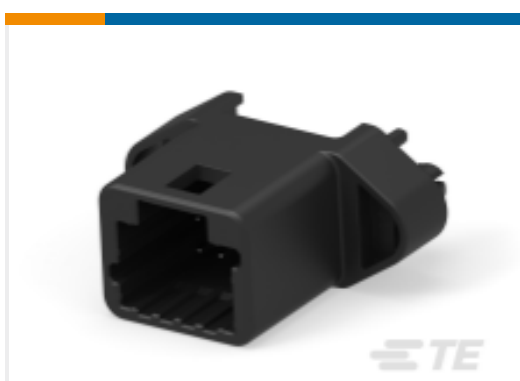
TE 产品编号1802826-1 8POS, TAB0.63X0.63, HDR ASSY, 180DEG, COD 1