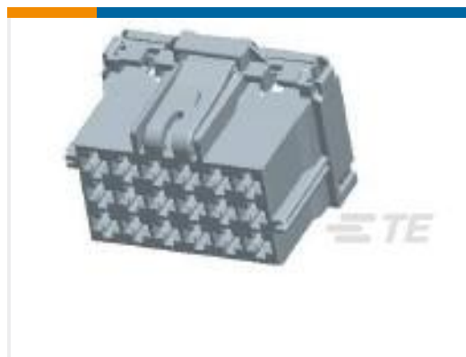
TE 产品编号5-968974-1 MCP2.8 GEH ASSY 18P