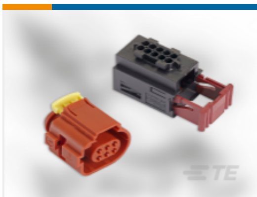
TE 产品编号4-967629-1 Timer Connector Housing