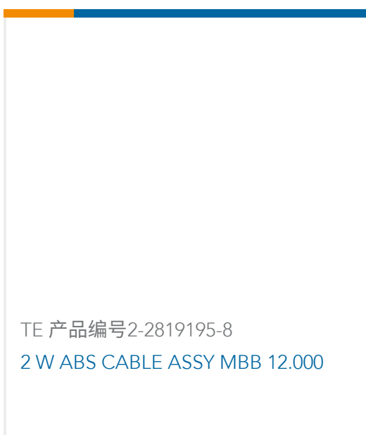
TE 产品编号2-2819195-8 2 W ABS CABLE ASSY MBB 12.000