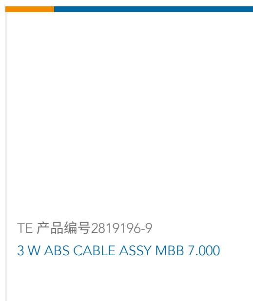
TE 产品编号2819196-9 3 W ABS CABLE ASSY MBB 7.000