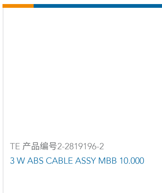
TE 产品编号2-2819196-2 3 W ABS CABLE ASSY MBB 10.000