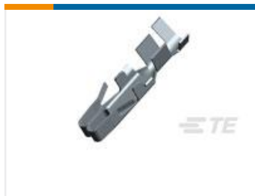
TE 产品编号880399-2 FUSE CONTACT