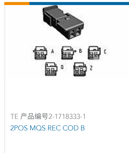
TE 产品编号2-1718333-1 2POS MQS REC COD B