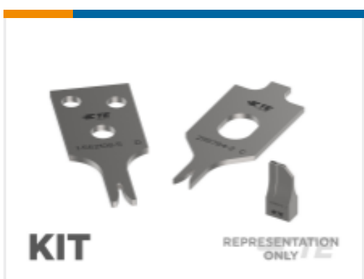
TE 产品编号 7-2151070-7 OCEAN_2.0_SPARE_PART_KIT-130F180OV