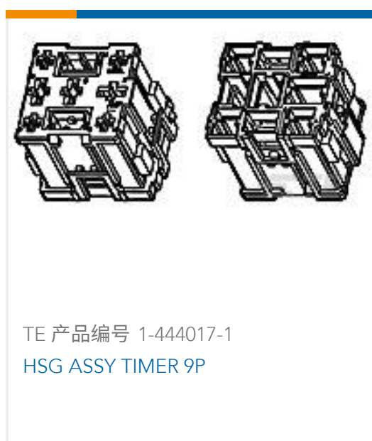
TE 产品编号 1-444017-1 HSG ASSY TIMER 9P