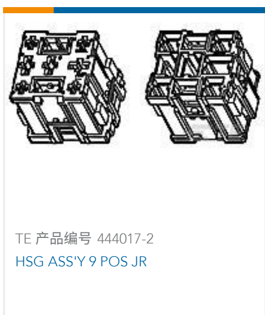
TE 产品编号 444017-2 HSG ASS'Y 9 POS JR