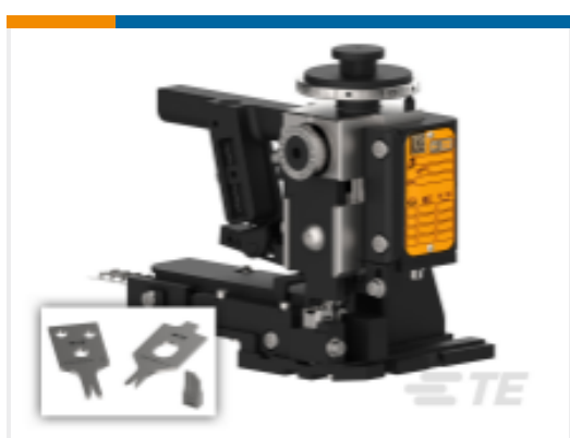
TE 产品编号 7-2151070-1 OCEAN_2.0_APPLICATOR-S-130F180OV