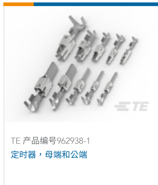
TE 产品编号962938-1 定时器, 母端和公端