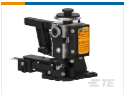
TE 产品编号 2151070-1 OCEAN_2.0_APPLICATOR-S-130F180OV