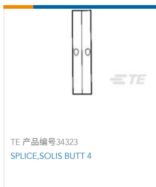
TE 产品编号34323 SPLICE,SOLIS BUTT 4