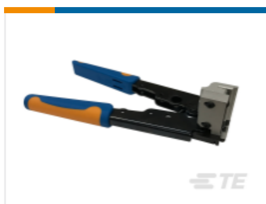
TE 产品编号 2305570-1 Strip Terminal Cutter-Side Feed-No Crimp