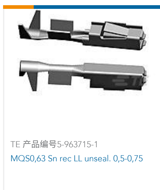
TE 产品编号5-963715-1 MQSO,63 Sn rec LL unseal. 0,5-0,75