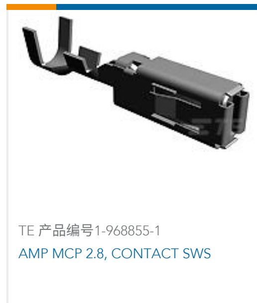
TE 产品编号1-968855-1 AMP MCP 2.8, CONTACT SWS