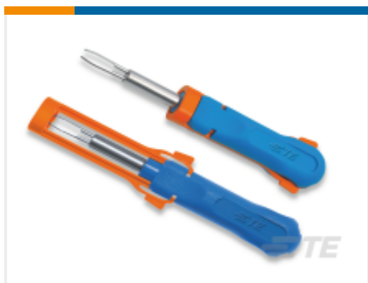
TE 产品编号 1-1579007-6 EXTRACTION TOOL