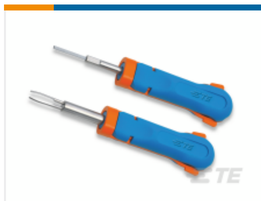
TE 产品编号 4-1579007-3 EXTRACTION TOOL KIT