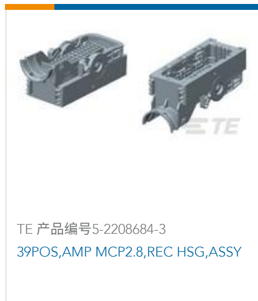
TE 产品编号5-2208684-3 39POS,AMP MCP2.8,REC HSG,ASSY