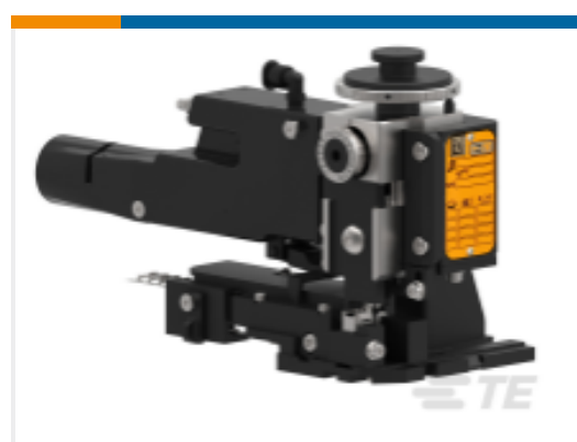
TE 产品编号 2151070-2 OCEAN_2.0_APPLICATOR-S-130F180OV