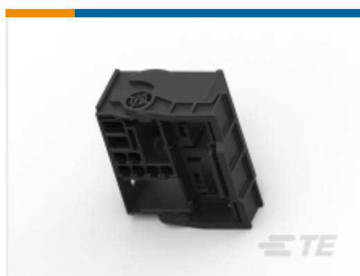
TE 产品编号 2-2278601-1 52POS., MIXED REC. HOUSNG, KIT