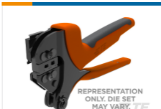
TE 产品编号 2393700-1 SDE F POWER TIMER 0.50-1.00 ASSY