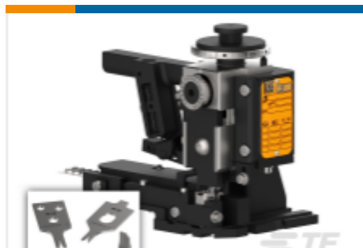
TE 产品编号 7-2151099-1 OCEAN_2.0_APPLICATOR-S-080F100OV