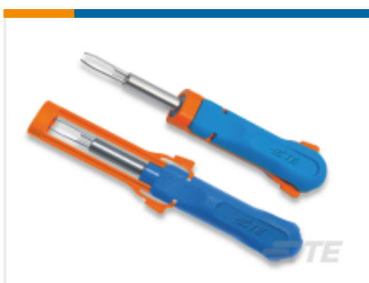
TE 产品编号 1-1579007-6 EXTRACTION TOOL