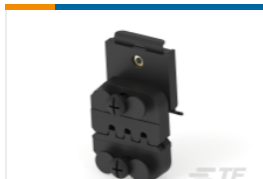
TE 产品编号 2393700-2 SDE F POWER TIMER 0.50-1.00 DIE SET