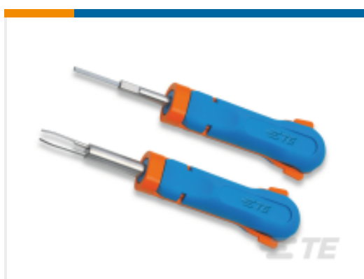
TE 产品编号 4-1579007-3 EXTRACTION TOOL KIT