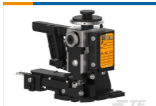
TE 产品编号 2151099-1 OCEAN_2.0_APPLICATOR-S-080F100OV