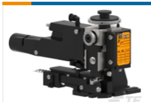
TE 产品编号 2151099-2 OCEAN_2.0_APPLICATOR-S-080F100OV