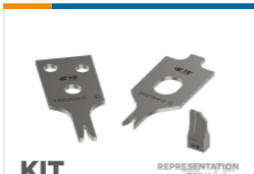
TE 产品编号 7-2151099-7 OCEAN_2.0_SPARE_PART_KIT-080F100OV