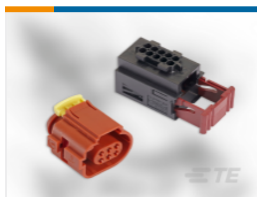
TE 产品编号 CAT-T4827-CH8172 Timer Connector Housing