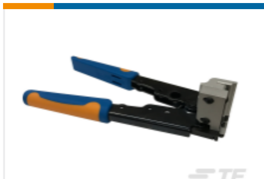
TE 产品编号 2305570-1 Strip Terminal Cutter-Side Feed-No Crimp