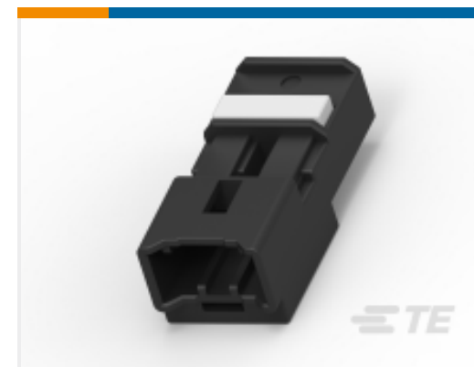
TE 产品编号 2109366-2 110 UNSLD 2P PLUG ASSY