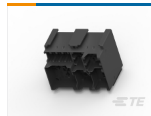
TE 产品编号 1801773-1 FUSES AND RELAYS HOLDER 6 MINIFUSES V2