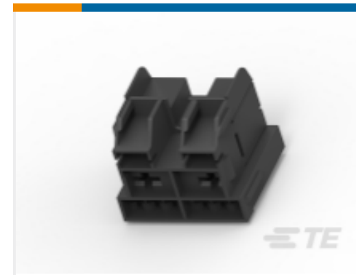
TE 产品编号 1380006-1 MINI RELAY SUPPORT