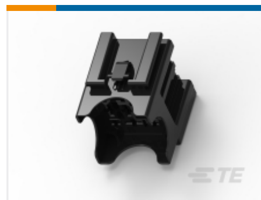
TE 产品编号 1801618-1 RELAY 40A HOLDER