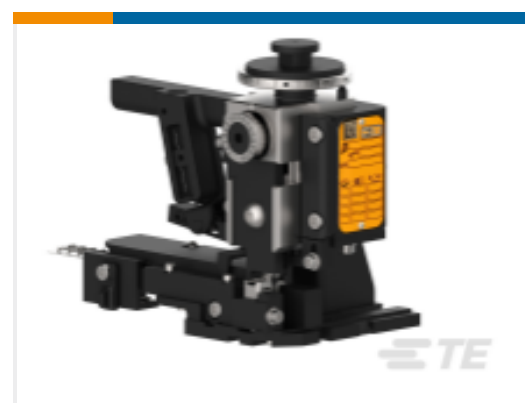
TE 产品编号 2151099-1 OCEAN_2.0_APPLICATOR-S- 080F100OV