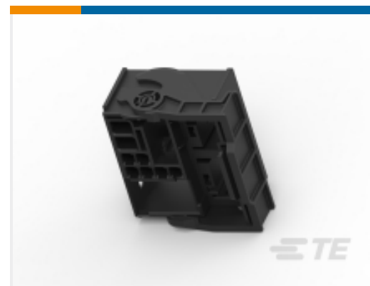
TE 产品编号 2-2278601-1 52POS., MIXED REC. HOUSNG, KIT