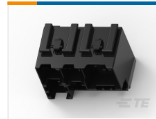
TE 产品编号 1801617-1 FUSES AND RELAYS HOLDER 6 MINIFUSES