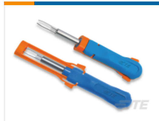
TE 产品编号 1-1579007-6 EXTRACTION TOOL