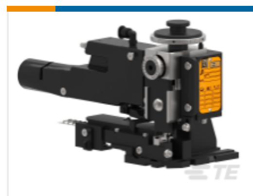
TE 产品编号 2151099-2 OCEAN_2.0_APPLICATOR-S- 080F100OV