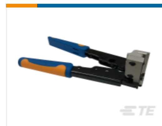
TE 产品编号 2305570-1 Strip Terminal Cutter-Side Feed-No Crimp