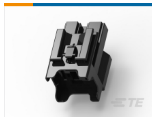
TE 产品编号 1801619-1 RELAY 70A HOLDER