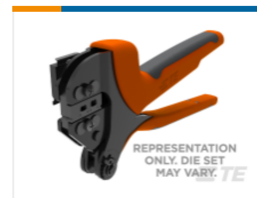
TE 产品编号 2393700-1 SDE F POWER TIMER 0.50-1.00 ASSY