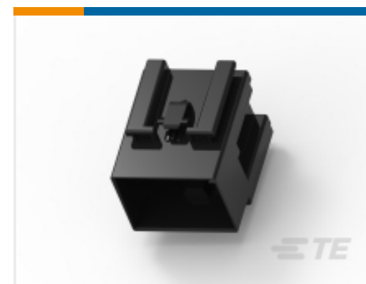
TE 产品编号 1801620-1 2 MICRORELAYS HOLDER