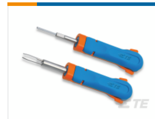
TE 产品编号 4-1579007-3 EXTRACTION TOOL KIT