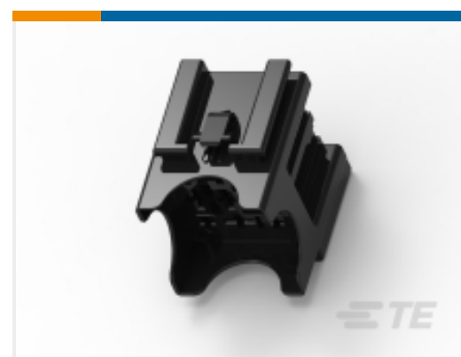
TE 产品编号 1801618-1 RELAY 40A HOLDER