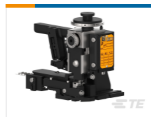
TE 产品编号 5-2151065-1 OCEAN_2.0_APPLICATOR-S- 062F0900-RSM