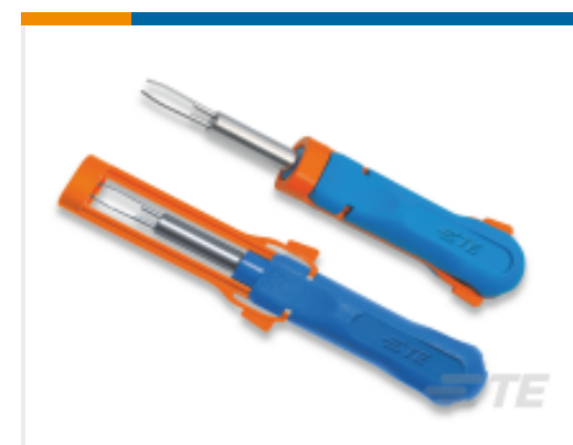
TE 产品编号 1-1579007-6 EXTRACTION TOOL