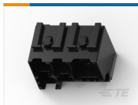
TE 产品编号 1801617-1 FUSES AND RELAYS HOLDER 6 MINIFUSES