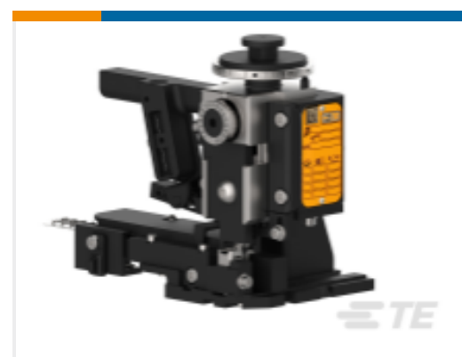
TE 产品编号 2151065-1 OCEAN_2.0_APPLICATOR-S- 062F0900-RSM