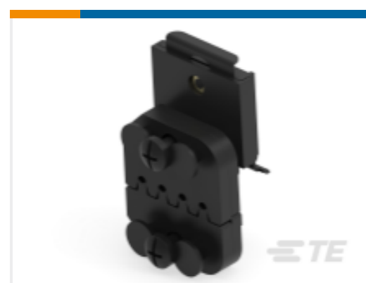
TE 产品编号 2392793-2 SDE F POWER CONTACT .22-.50 DIE SET