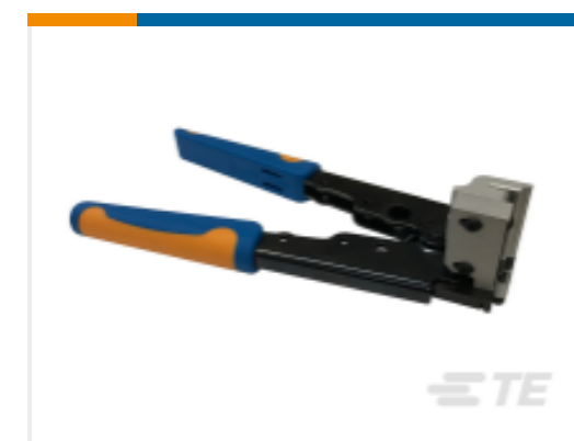
TE 产品编号 2305570-1 Strip Terminal Cutter-Side Feed-No Crimp