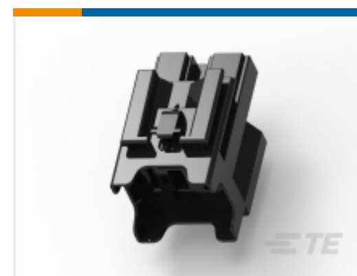
TE 产品编号 1801619-1 RELAY 70A HOLDER