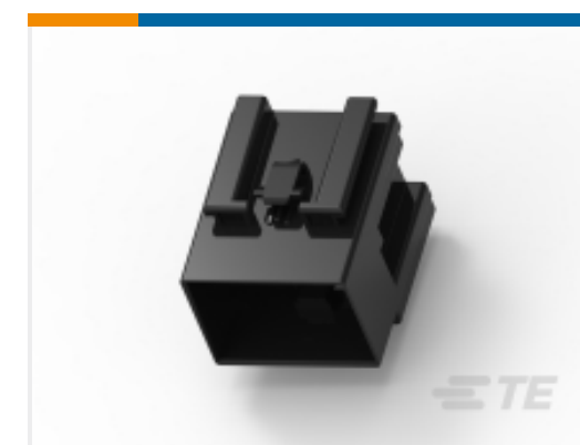
TE 产品编号 1801620-1 2 MICRORELAYS HOLDER