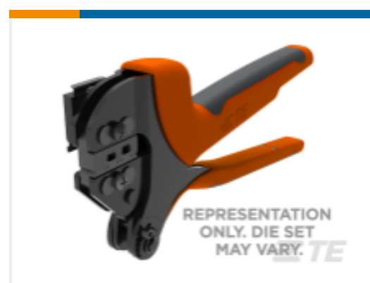
TE 产品编号 2392793-1 SDE F POWER CONTACT 22-50 O ASSY