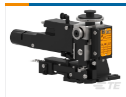
TE 产品编号 2151065-2 OCEAN_2.0_APPLICATOR-S- 062F0900-RSA