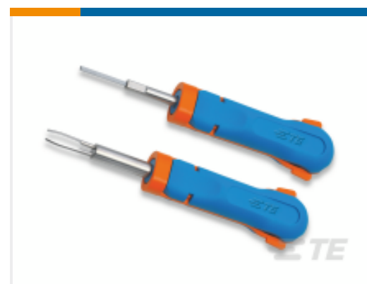
TE 产品编号 4-1579007-3 EXTRACTION TOOL KIT