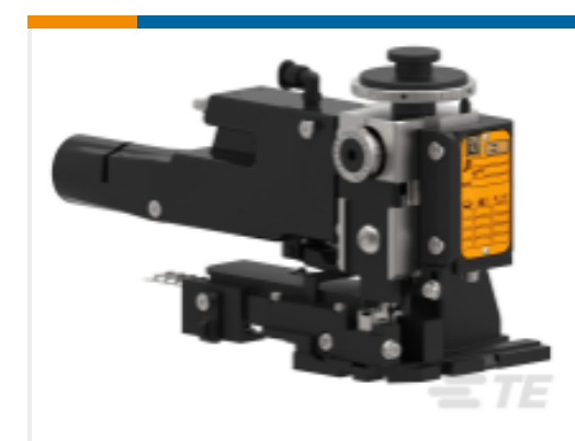
TE 产品编号 5-2151065-2 OCEAN_2.0_APPLICATOR-S- 062F0900-RSA