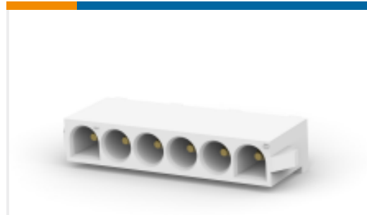
TE 产品编号643408-3 06P UMNL PIN HDR ASY POL V0 AU