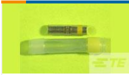
TE 产品编号650076-000 D-436-38