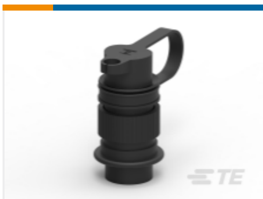
TE 产品编号CAR2PC68-001 CAR PLUG DIN9680 2way, IP68