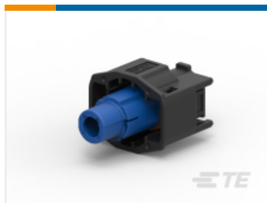
TE 产品编号DTSK06-1-08SB PLUG, INLINE, KEY B