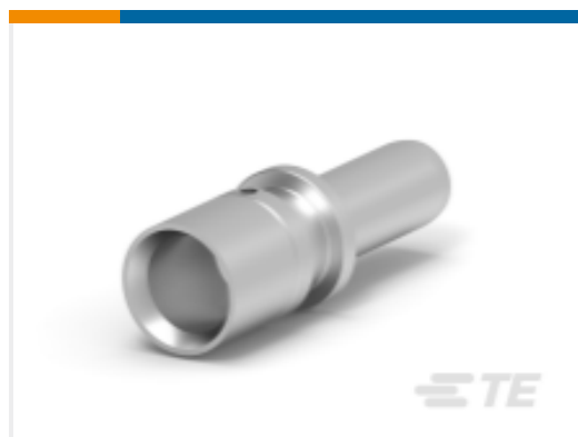
TE 产品编号SRK-PC-080-35-601 PIN, SOLID, SIZE M8, 35mm2, AG