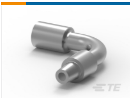
TE 产品编号HC5957 BATT.LEAD 90 DEG 70MM-VE.