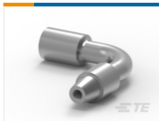
TE 产品编号HC5956 BATT.LEAD 90 DEG 70MM+VE.