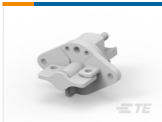
TE 产品编号K1128688 Battery Disconnecter 35-411-130-R-900