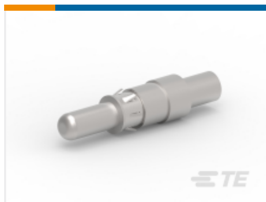
TE 产品编号DARS24296-000A3 CAR PIN STANDARD CONT. #5, silver plated