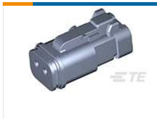
TE 产品编号DT06-2S-P060 PLG, 2P, BLK, BUSBAR 1X2, NICKEL