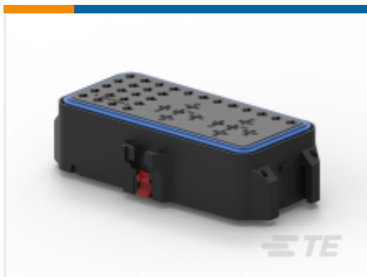
TE 产品编号2297813-2 BASE ASSY, 38 POSN ISO FUSE AND RELAY