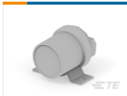
TE 产品编号K1012918 Relay 26-70-04