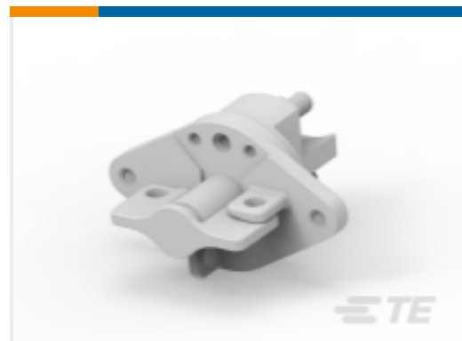
TE 产品编号K1128688 Battery Disconnecter 35-411-130-R-900