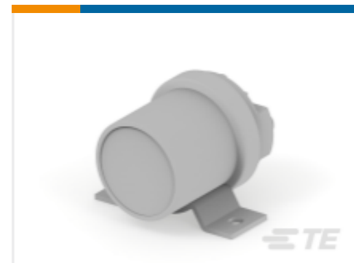
TE 产品编号K1012918 Relay 26-70-04