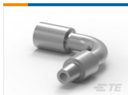
TE 产品编号HC5957 BATT.LEAD 90 DEG 70MM-VE.