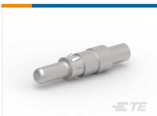
TE 产品编号DARS24296-000A3 CAR PIN STANDARD CONT. #5, silver plated