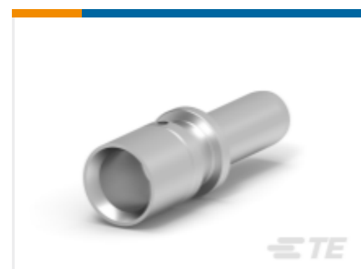
TE 产品编号SRK-PC-080-35-601 PIN, SOLID, SIZE M8, 35mm2, AG