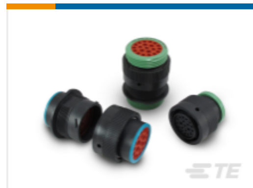
TE 产品编号HDP24-24-35SE DEUTSCH HDP20 Housings