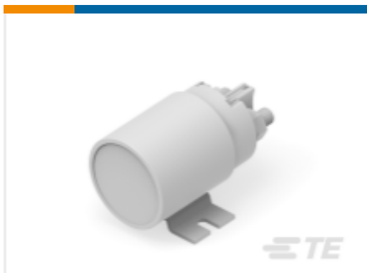
TE 产品编号K1127684 Relay 29-112-12