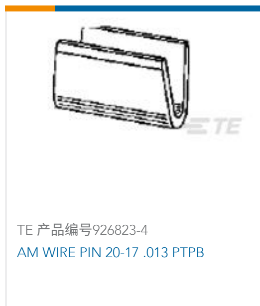
TE 产品编号926823-4 AM WIRE PIN 20-17 .013 PTPB