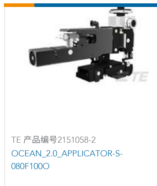
TE 产品编号2151058-2 OCEAN_2.0_APPLICATOR-S-080F1000