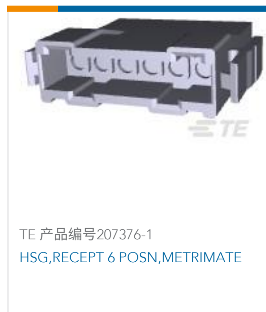
TE 产品编号207376-1 HSG,RECEPT 6 POSN,METRIMATE