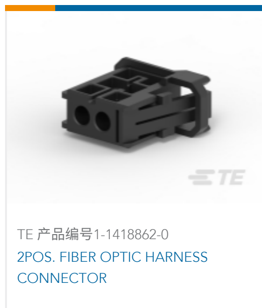
TE 产品编号1-1418862-0 2POS. FIBER OPTIC HARNESS CONNECTOR