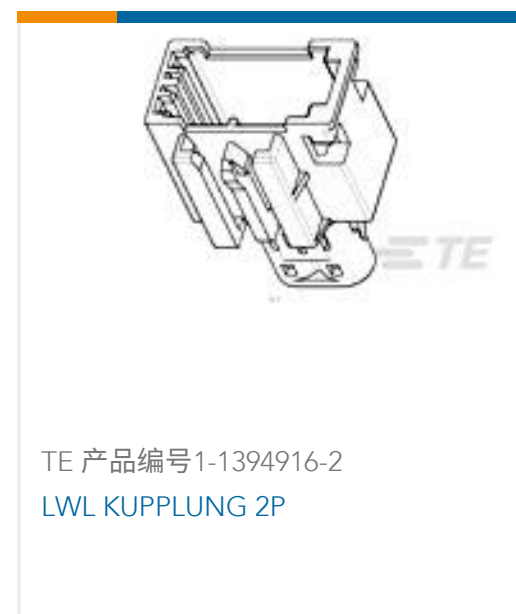
TE 产品编号1-1394916-2 LWL KUPPLUNG 2P