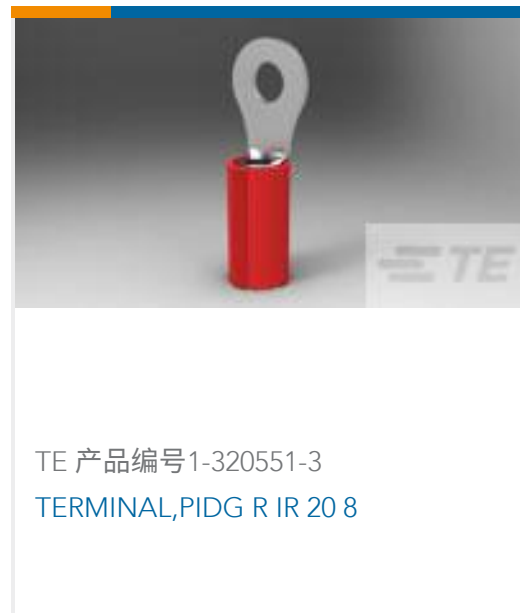
TE 产品编号 1-320551-3 TERMINAL,PIDG R IR 20 8