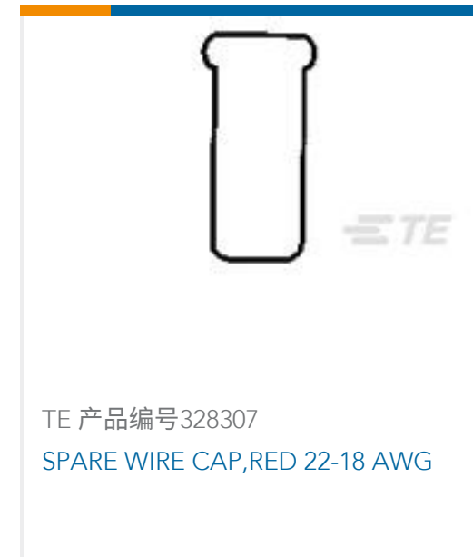
TE 产品编号 328307 SPARE WIRE CAP,RED 22-18 AWG