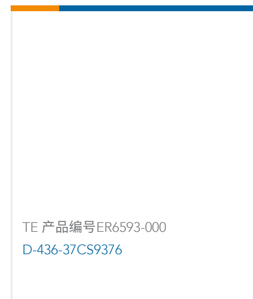
TE 产品编号 ER6593-000 D-436-37CS9376