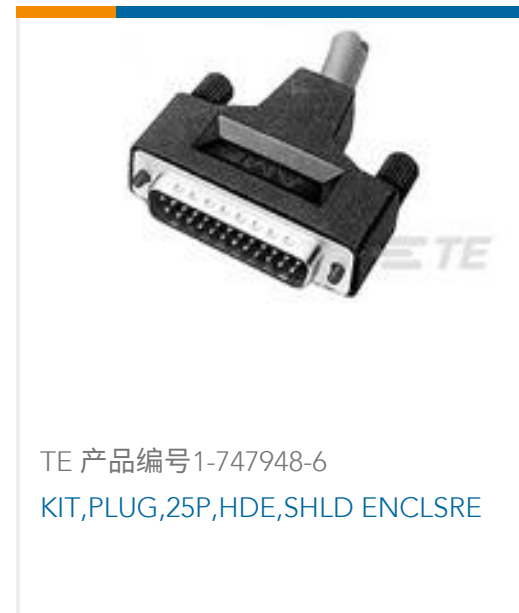
TE 产品编号 1-747948-6 KIT,PLUG,25P,HDE,SHLD ENCLSRE