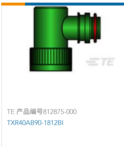
TE 产品编号 812875-000 TXR40AB90-1812BI