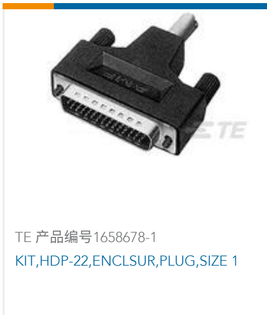
TE 产品编号 1658678-1 KIT,HDP-22,ENCLSUR,PLUG,SIZE 1