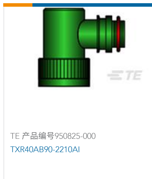
TE 产品编号 950825-000 TXR40AB90-2210AI