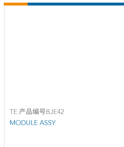
TE 产品编号 BJE42 MODULE ASSY