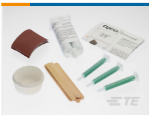
TE 产品编号 657863-000 S1125-KIT-8