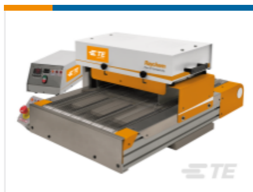
TE 产品编号 2326489-1 MODEL 105 TUNNEL OVEN, 36" ENTRY, STAND