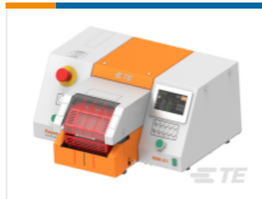
TE 产品编号 2234800-1 RBK-X1 STD