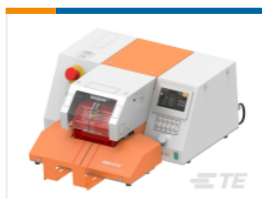
TE 产品编号 2376800-2 RBK-X1C CE STD