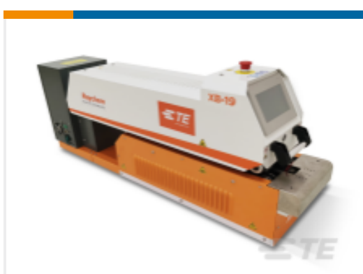
TE 产品编号 2375320-1 XB19 Belt Heater, STD