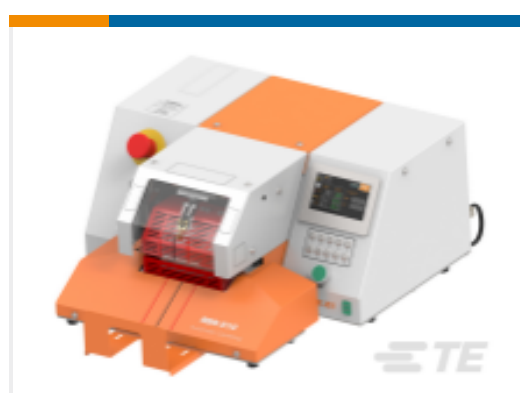
TE 产品编号 2376800-1 RBK-X1C STD