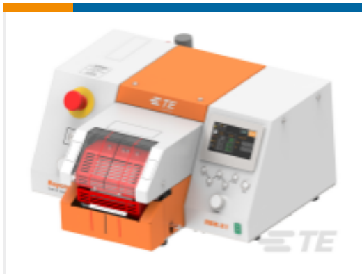
TE 产品编号 1-2234800-4 RBK-X1 CE, W/ AIR COOLING