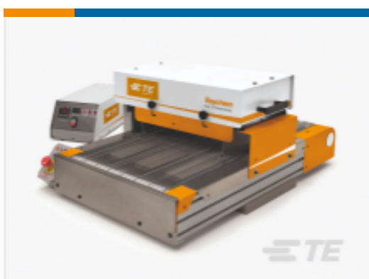
TE 产品编号 955018-000 CLTEQ-M105-TUNNEL-OVEN