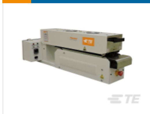
TE 产品编号 2280355-1 220 V MODEL 17