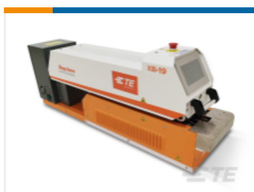
TE 产品编号 2375320-2 XB19 Belt Heater, 150mm (6") Version