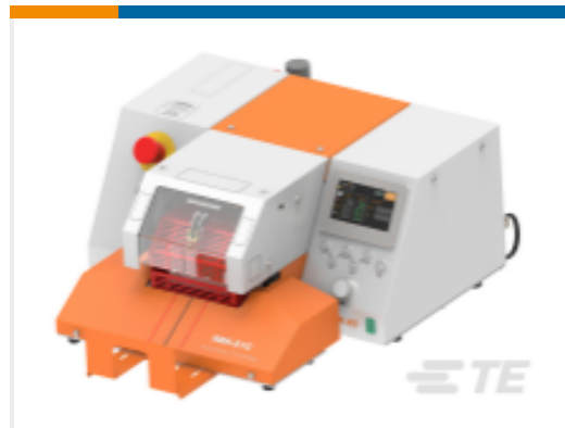
TE 产品编号 1-2376800-4 RBK-X1C CE, W/ AIR COOLING