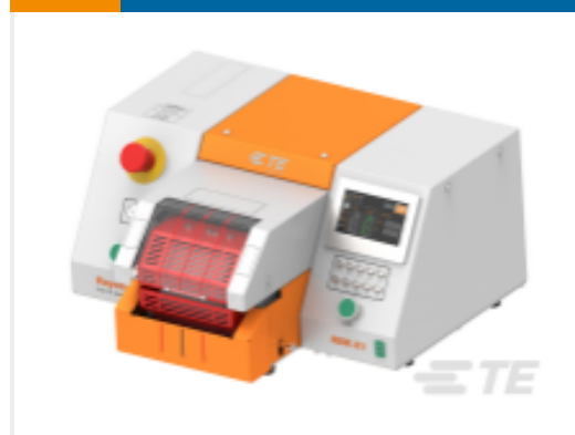
TE 产品编号 1-2234800-1 RBK-X1, AUTO TRIGGER