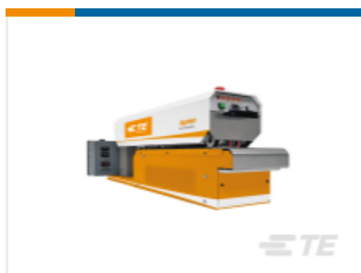
TE 产品编号 714529-000 CLTEQ-M19-BELT-HTR