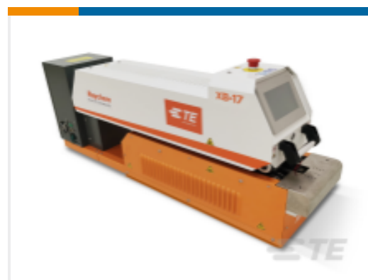
TE 产品编号 2375310-2 XB17 Belt Heater, 110V