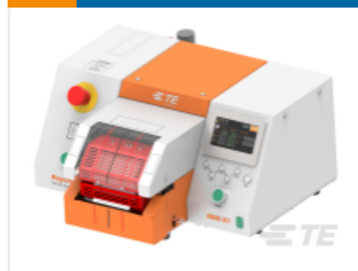
TE 产品编号 1-2234800-3 RBK-X1, W/ AIR COOLING