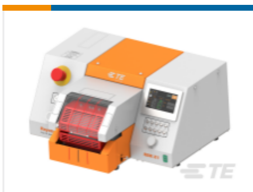
TE 产品编号 2234800-2 RBK-X1 CE STD