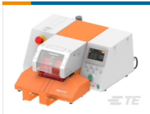
TE 产品编号 1-2376800-3 RBK-X1C, W/ AIR COOLING