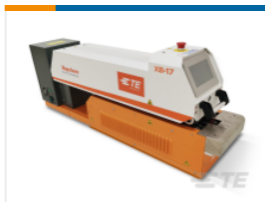
TE 产品编号 2375310-1 XB17 Belt Heater, 220V