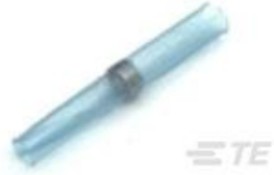
TE 产品编号625160-000 D-110-41