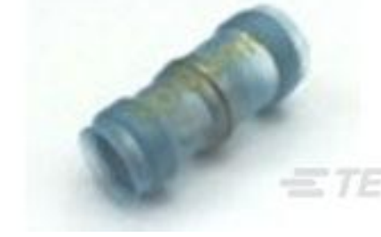
TE 产品编号621054-000 D-142-50