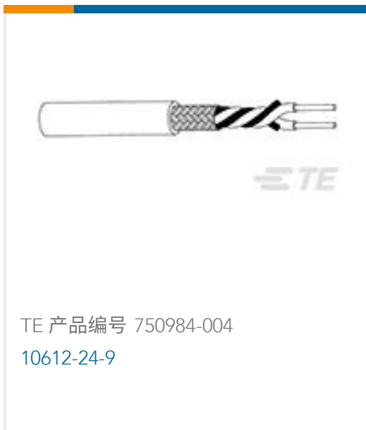
TE 产品编号 750984-004 10612-24-9