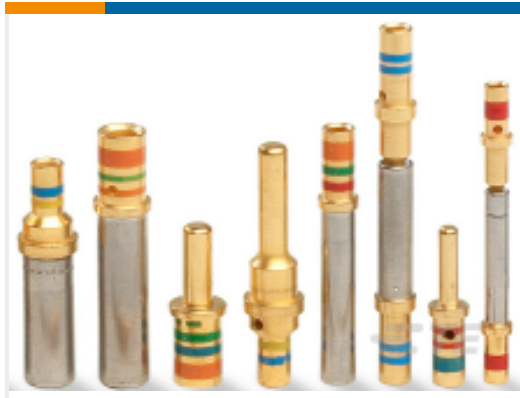
TE 产品编号4160-202-2031L CONT PIN