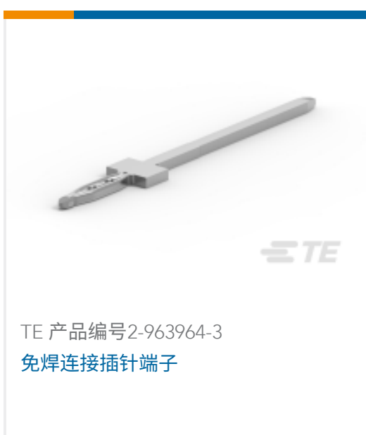
TE 产品编号2-963964-3 免焊连接插针端子