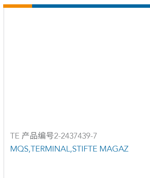
TE 产品编号2-2437439-7 MQS,TERMINAL,STIFTE MAGAZ