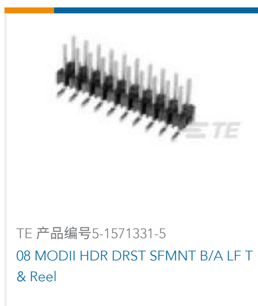
TE 产品编号5-1571331-5 08 MODII HDR DRST SFMNT B/A LF T & Reel