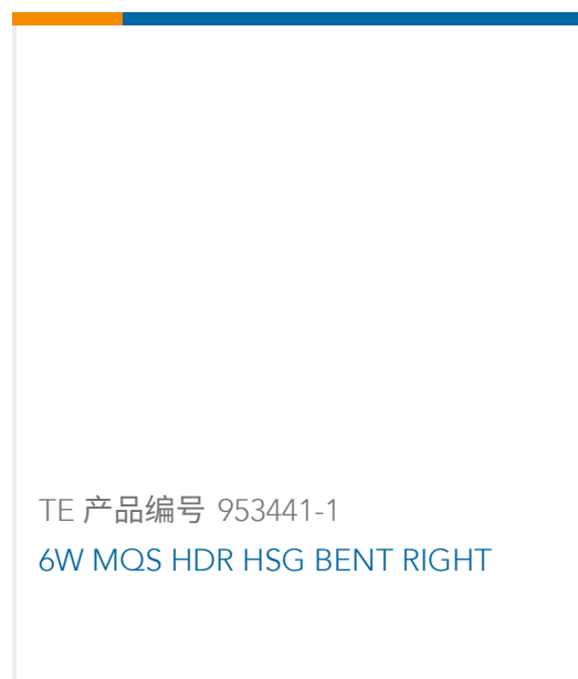
TE 产品编号 953441-1 6W MQS HDR HSG BENT RIGHT