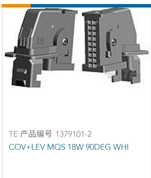
TE 产品编号 1379101-2 COV+LEV MQS 18W 90DEG WHI