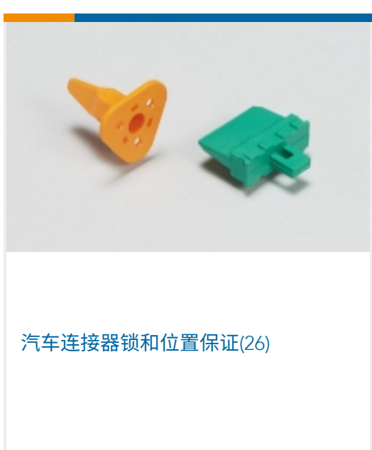
汽车连接器锁和位置保证(26)