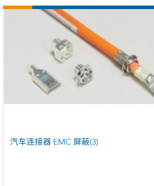
汽车连接器 EMC 屏蔽(3)