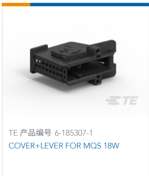
TE 产品编号 6-185307-1 COVER+LEVER FOR MQS 18W