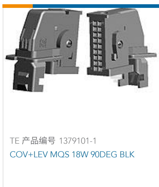
TE 产品编号 1379101-1 COV+LEV MQS 18W 90DEG BLK