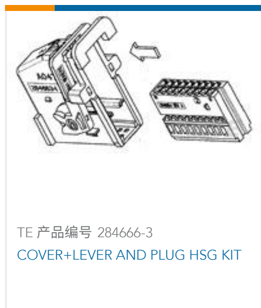
TE 产品编号 284666-3 COVER+LEVER AND PLUG HSG KIT